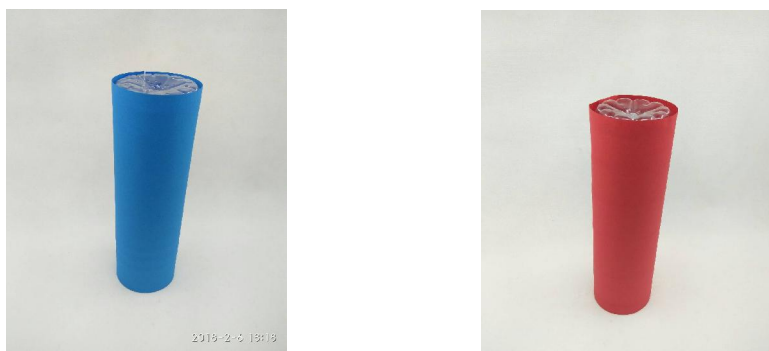
【圖 2】貼上色紙的寶特瓶(顏色因攝影或有色差)