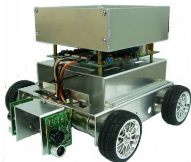
輪型機器人負重致遠比賽 參考作品 益眾產品型號：A03-0501